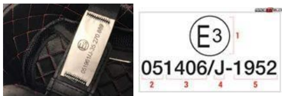
Europa ECE R22-05/06

JIS XXX (Trade mark of certification body) Protective helmet for motor vehicle users T8133:2015 Class 2 Certification No. XX0000000 Label serial No. 000000000 Manufacturer's name