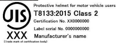
Japón JIS T8133:2015