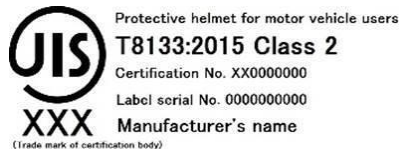
Japón JIS T8133:2015